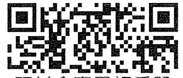
研討會專用訂房單