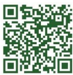
本系研究生定稿&離校