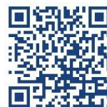
圖書館學位論文繳交