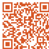
註冊組離校程序單